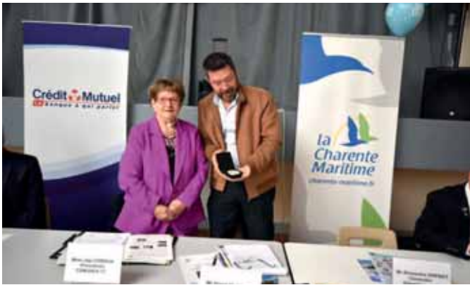
Monsieur le Maire de Rouffiac