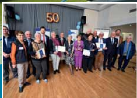
CDMJSEA : 50 ème A.G. PAGES 7 À 11