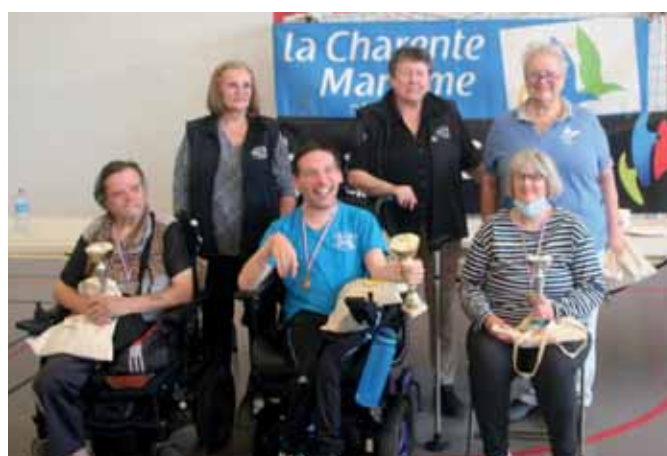
Podium des individuels