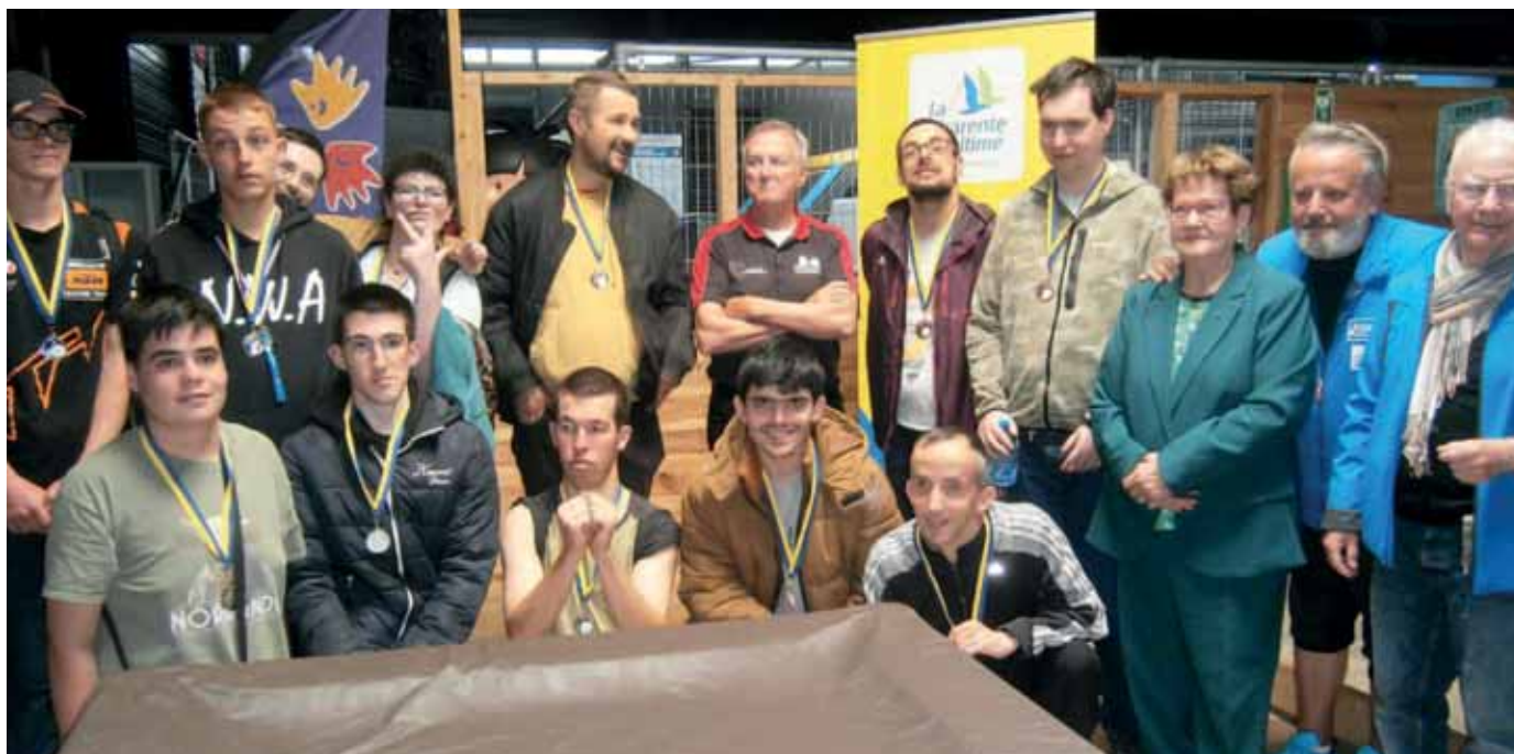
Podium du jeudi