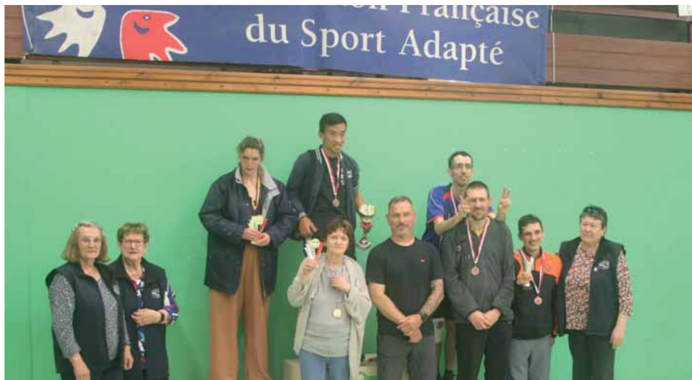
Vainqueurs sur toute la saison