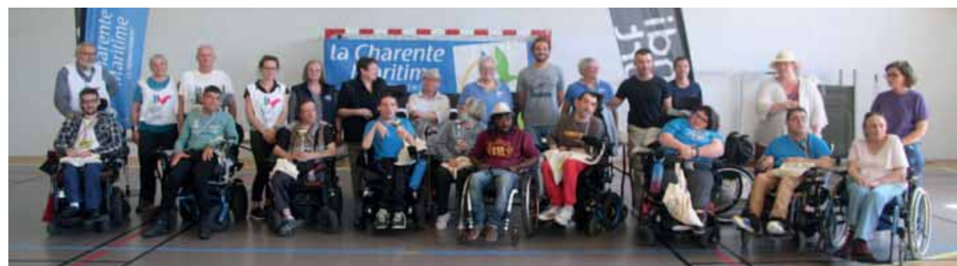
Podium individuel avec bénévoles et accompagnants