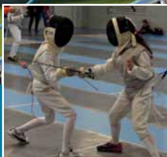
CHALLENGE JEUNES : ESCRIME - TENNIS DE TABLE PAGES 17 À 29