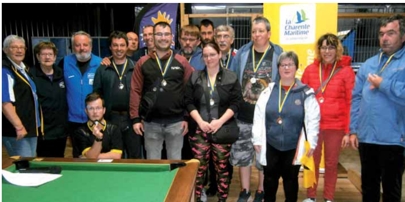
Podium du samedi